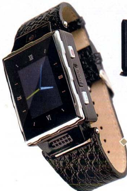
Tutto compreso Timephone da polso con funzione vivavoce Bluetooth, fotocamera e lettore Mp3. Kiwie (199 euro)