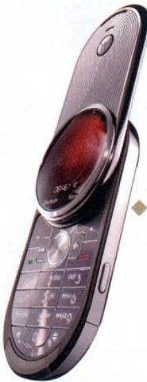
Rotante Telefono cellulare Aura de-luxe con display Lcd circolare e protezione in vetro zaffiro. Motorola (1.500 euro)