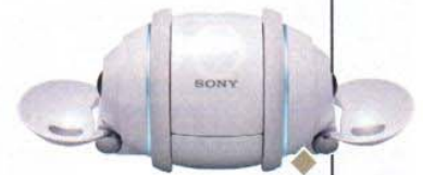
Mini automa Robottino/lettore Mp3 Rolly, portatile con diffusori acustici e memoria interna da 2 Gb. Sony (399 euro)