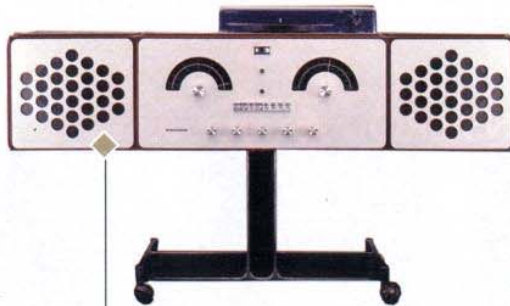
Secondo tradizione Impianto con radio, amplificatore, giradischi, lettore cd/dvd e diffusori stereo. Brionvega (prezzo su richiesta)