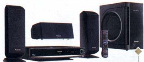
Per interattivi Sistema home theater multi-canale SC-BT100 ad alta definizione con lettore Blu Ray. Panasonic (999 euro)