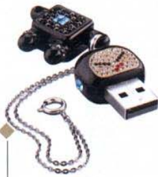
Techno lustrini Chiavetta Usb con Swarovski multicolor, memoria da 2 Gb. Philips Swarovski (149 euro)