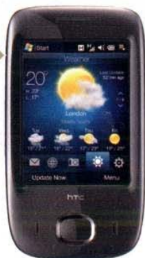
Da toccare Cellulare Touch Viva con Windows Mobile 6.1 Prof. e fotocamera da 2 megapixel. Htc (279 euro)