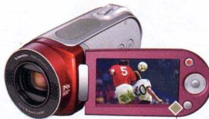
Pronti per internet Videocamera digitale MX20 a schede di memoria flash con modalità di ripresa "YouTube". Samsung (199 euro)